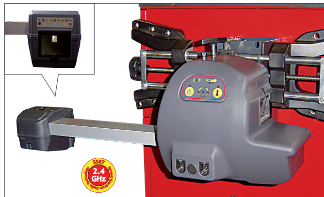
Accessoires en option Accesorios opcionales